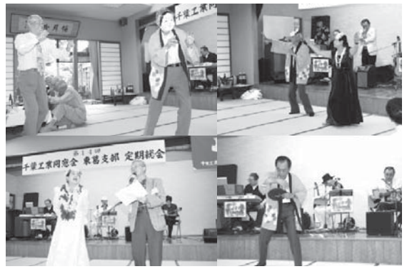
●会場の皆さんも続々飛び入り参加