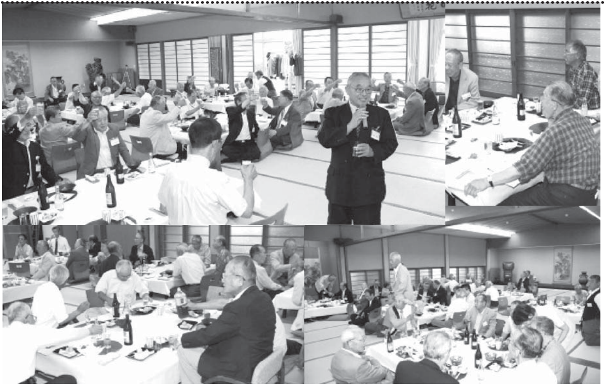
● 永峯顧問の乾杯ご発声で懇親会の始まり