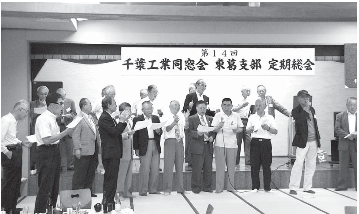
●親睦会の最後は定例の校歌斉唱で幕が下りた